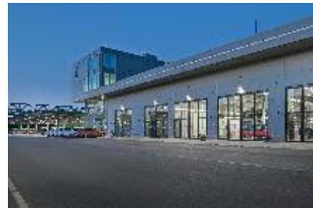
Bildunterschrift: State-of-the-art: mit Unterstützung des agn-Projektmanagements wurde der Busbetriebshof Hamburg-Langenfelde runderneuert und für Hybridtechnik ausgerüstet

Auftraggeber: Hamburger Hochbahn AG Leistung: Projektsteuerung