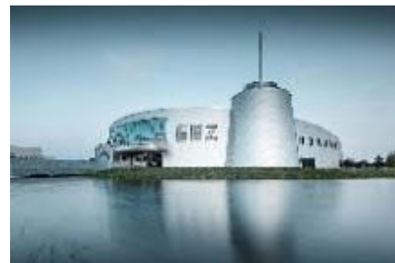
Bildunterschrift: Forschung zum Anfassen bietet das Energie-, Bildungs- und Erlebniszentrum (EEZ), dessen Bau agn als Projektsteuerer begleitet hat

Auftraggeber: Auricher Bäder und Hallenbetriebs GmbH & Co KG, Stadt Aurich Generalplaner: Architekturbüro Tabery, Bremerförde Leistung: Projektsteuerung